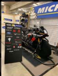
Organisation intérieure de notre stand durant un week-end de course