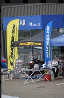
Exposition de nos partenaires lors d'une de nos journées de roulage

Le sport moto véhicule une image dynamique et est devenu un puissant vecteur de communication pour les partenaires qui n'ont pas forcément un lien direct avec cet univers. Votre notoriété déjà établie se verra renforcée par notre philosophie du mécénat qui implique un retour sur investissement et nous vous invitons à nous rejoindre pour cette saison qui s'annonce exceptionnelle en termes de retombées.